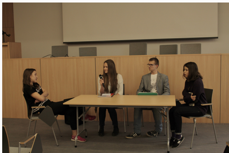
Mediatorzy rówieśniczy

W kolejnych latach grono mediatorów rówieśniczych powiększało się, a w bieżącym roku szkolnym nauczyciele zgłosili zapotrzebowanie na szkolenie mediacyjne, ponieważ zauważyli że stosowanie tej metody daje sukcesy – zmniejsza stres związany z konfliktem. Na terenie szkoły pracuje obecnie 12 mediatorów rówieśniczych oraz 6 mediatorów dorosłych – nauczycieli V LO. Co daje im mediacja? Umiejętności komunikacyjne, zarządzania konfliktem, przeciwdziałania zjawisku przemocy w szkole i innych miejscach w których na co dzień przebywają młodzi ludzie. Daje też poczucie odpowiedzialności za własne konflikty i wdrażanie w życie ich rozwiązań.